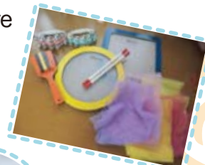
drum · scarf · etc...